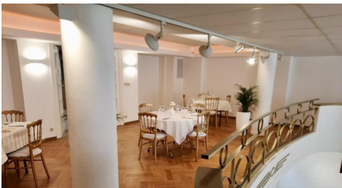
Le coin VIP sur le balcon. - De VIP-hoek op het balkon