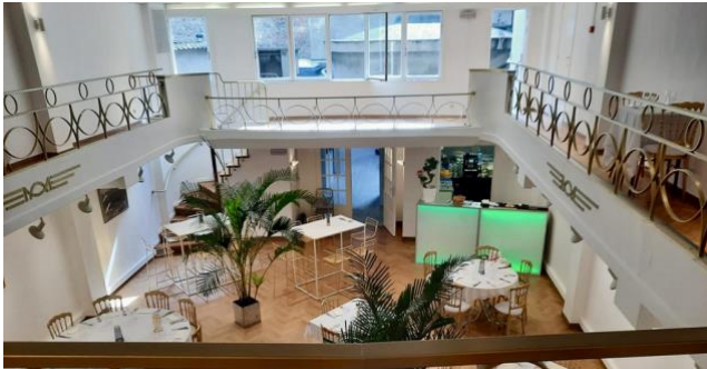
Vue du bar temporaire à partir du balcon Zich van de tijdelijke bar vanaf het balkon