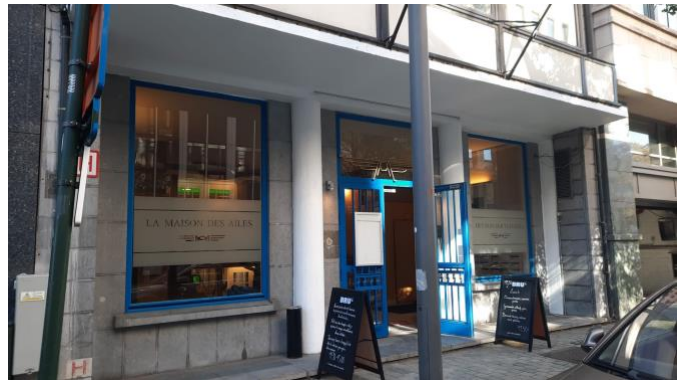
L'entrée sans l'auvent De ingang zonder het bordes