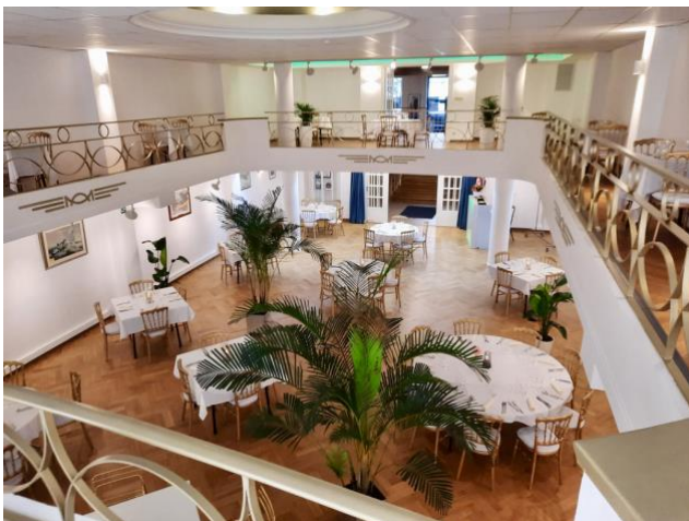
L'entrée de la salle Leboutte à partir du balcon De ingang van de Leboutte-zaal vanaf het balkon