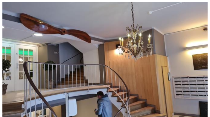
Le hall d'entrée new look De ingangshall new look