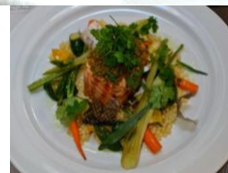
Bon appétit! - Smakelijk!