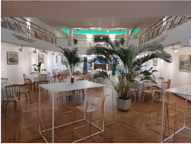
La salle Leboutte vue à partir du fond De Leboutte-zaal van achteren gezien